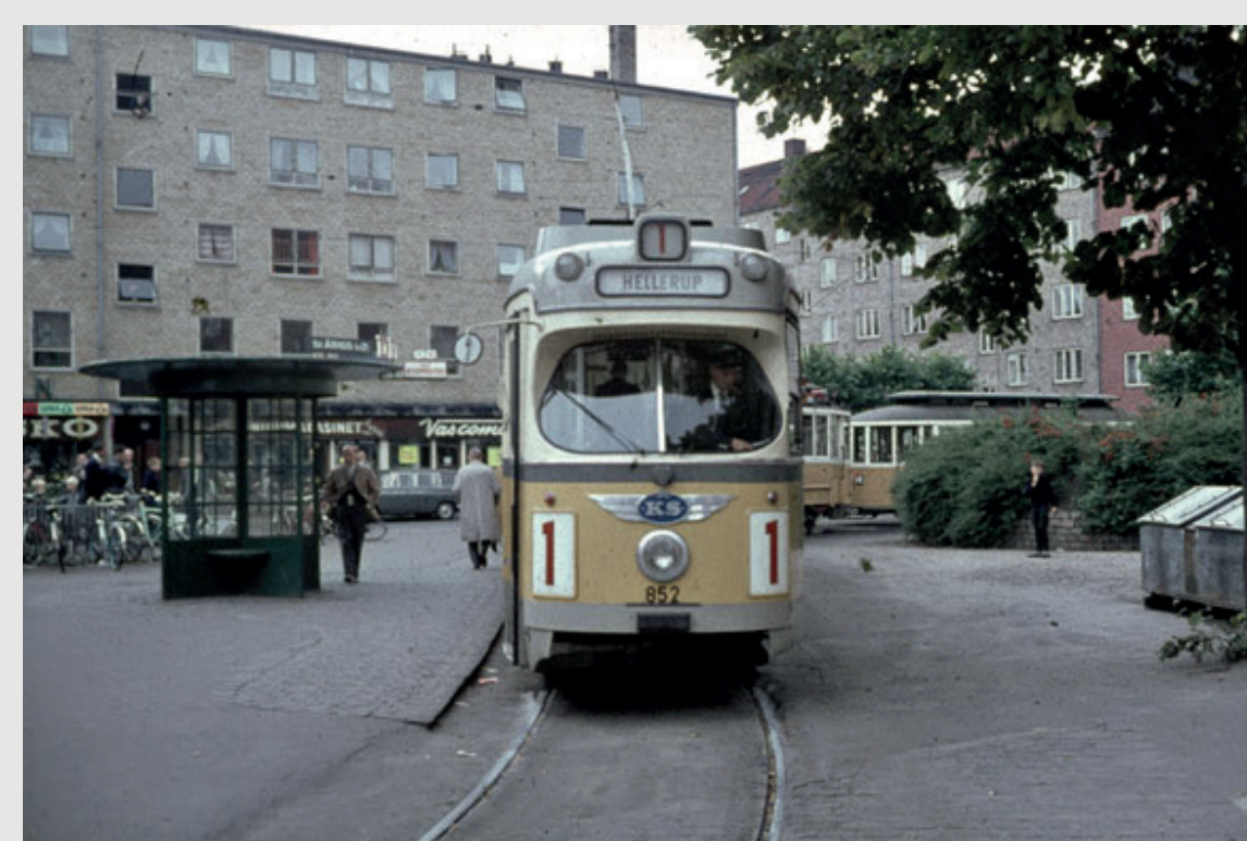
Sporvognslinje 1 (1965), www.vognstyre.dk , foto Erik Reimann

De elektriske sporvogne i København var i drift fra cirka 1900 og frem til 1960'erne. Fra 1937 var Helga Larsens Plads vendesløjfe for sporvognslinje 1 mod Hellerup via Rådhuspladsen. Senere blev den anvendt som busløjfe. Da bussernes ruter blev forlænget og pladsen ophørte med at være vendeplads, blev sløjfen i stedet fyldt med parkerede biler. Alle parkeringspladser på Helga Larsens Plads nedlægges inden for det kommunale areal, som er det areal, der nu omdannes.